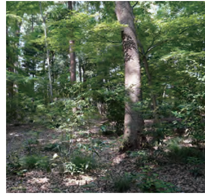
薪や防風に植えた木々は樹齢70年の高木に。