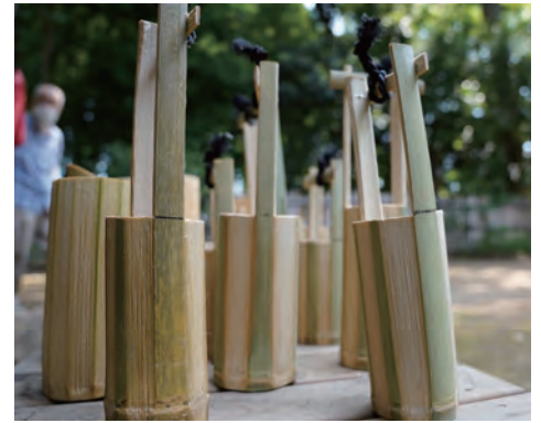
敷地の整備で出る竹や木の廃材を活かし楽しむ。