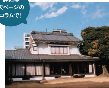
俗称:源蔵(ゲンゾウ) (マンション/東町3丁目)

北新田(現・東町3)で藍や金融業で得た資産をもとに、事業のための土地を購入するなど拡大し、それをもとに鉄道の誘致や宅地造成を進めた。