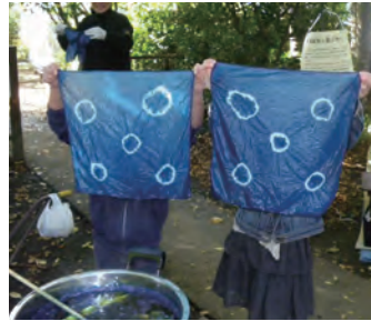
かつて保谷では藍玉づくりが産業の一つだった。下保谷の藍を伝えるイベントも行われている(主催:西東京市教育委員会)