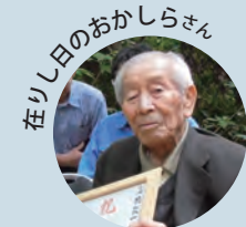
在りし日のおかしらさん