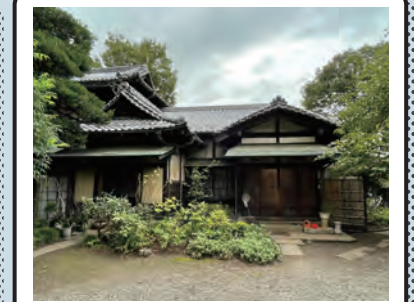
俗称:作左衛門(サクザ) (私邸/下保谷3丁目)

有力者だけが作ることを許された門(明治8)、主屋(昭和2)、蔵など、5つの建造物が国指定重要文化財となっている。庭には樹齢350年以上という大ケヤキがそびえ立つ。