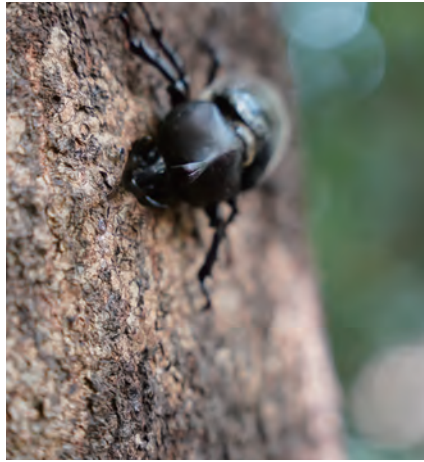
林の中にはカブトムシも。