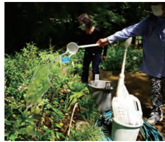
野草園(高橋家屋敷林保存会) 解放日:毎週金曜日10時~12時