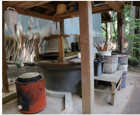
井戸もまだ現役で稼働している。