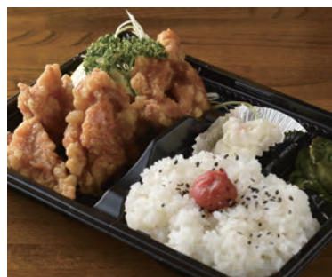
注文受けてから作るできたて弁当も人気。