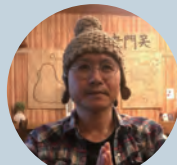
まんがと文 永井サク

連載が4回目なのに、まだお地蔵様を紹介していなかったことに気が付いたよ! お地蔵様は、おばあちゃん原宿「とげぬき地蔵」で超有名だから、みんな知ってるよね! 正確には地蔵菩薩という名前だ。今回紹介するのは、住吉町の東禅寺というお寺にある六地蔵だよ。ポーズや持ち物がそれぞれ違うから、じっくり観察だ! えっ? どうして6人もいるの? それは、人が死んだ後に行く六つの世界、「六道」のどれに行った人でも救ってあげられるように、1人の地蔵菩薩が6つの姿になってスタンバイしているのさ! 安心だね! でも、すぐに救ってもらえるかは分からないから、地獄に行かないように、良い子でいようね! レッツ石仏巡り!