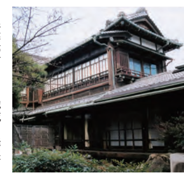
高橋邸解体前(平成14年:2002)

資産家として地域の発展に尽力した高橋源蔵家ですが、文太郎が45歳(昭和23・1948)の若さで亡くなると、当時「保谷御殿」と呼ばれた高橋家の屋敷(東町)は、西武鉄道の堤康次郎の手に渡り「保谷武蔵野」という北京料理の料亭に。平成14年(2002)に惜しまれつつ解体された後、ファミリーレストランを経て現在は大規模なマンションになりました。高橋家は、他にも駅前商店街の開発、文化住宅の誘致・造成、農場設立、グラウンド跡地など、土地提供などを通して地元の発展に貢献しました。グラウンド跡地を活用した文理台公園では、近年夏祭り・花火大会が開かれてきました。