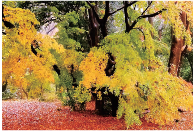
一般公開は、主に「観桜会」「紅葉を楽しむ会」の年2回。市と市民が協力し様々な催しや活動が行われている。(主催:西東京市みどり環境部みどり公園課)