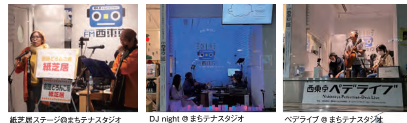
紙芝居ステージ@まちテナスタジオ DJ night @まちテナスタジオ ベデライブ@まちテナスタジオ

市民も使えるまちテナスタジオ。動画の配信スタジオや音声の録音、ミニライブなどのパフォーマンスにご使用いただけます。詳細はFM西東京までお気軽にお問い合わせ下さい。