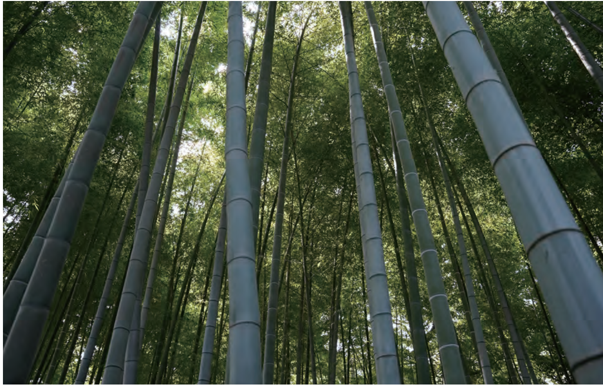
屋敷林北東部に残る孟宗竹の竹林。大根を干したり、漬物樽の箍(たが)として使うため敷地内で育てていた。