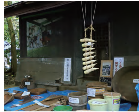
民具の展示。保谷の歴史は、たくあん抜きでは語れない。