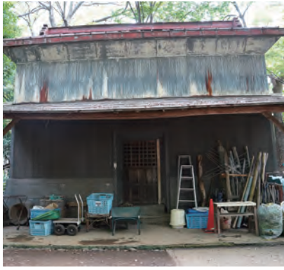
農業や暮らしの道具が収納されていた蔵。